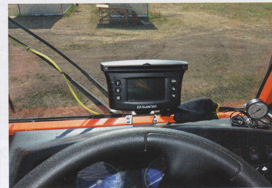
Новая система спутниковой навигации Trimble Guide EZ-250.

Итак: по результатам изучения обеих новинок мы остались под приятным впечатлением, особенно с учетом значительного отрыва «Тумана-1» и «Тумана-2» от ближайших зарубежных конкурентов по цене в сторону уменьшения. Темпы модернизации этих машин позволяют рассчитывать на высокий интерес к ним уже в ближайшее время не только внутри России, но и далеко за ее пределами.