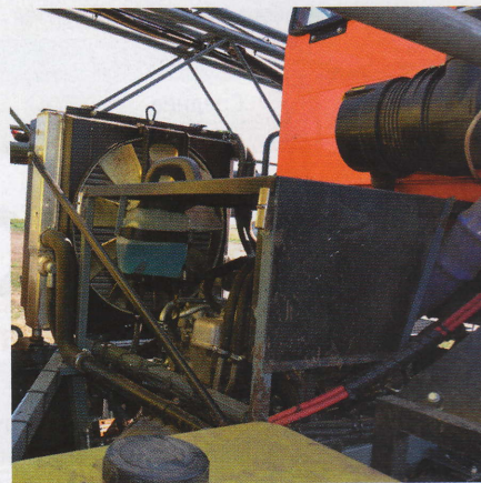
Комбинированный теплообменник с гидравлическим приводом вентилятора системы охлаждения.