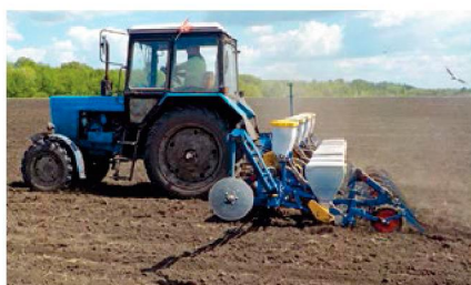
Сеялка в агрегате с трактором МТЗ-82 в транспортном положении и в работе

Назначение. Предназначена для точного пунктирного высева калиброванных и отсортированных семян пропашных культур с одновременным внесением гранулированных минеральных удобрений.