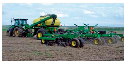
Сеялка в составе посевного комплекса в агрегате с трактором John Deere 8310R в работе