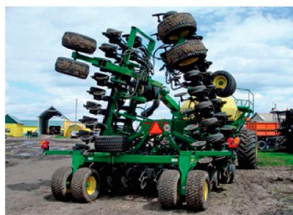
Сеялка в транспортном положении

Назначение. Предназначена для посева всех видов культур, за исключением пропашных, по минимально обработанным и не обработанным фонам с одновременным прикатыванием и внесением минеральных удобрений. Применение сеялки предусмотрено в энергосберегающих и почвозащитных технологиях в составе посевного комплекса с загрузчиком семян модели 1910.